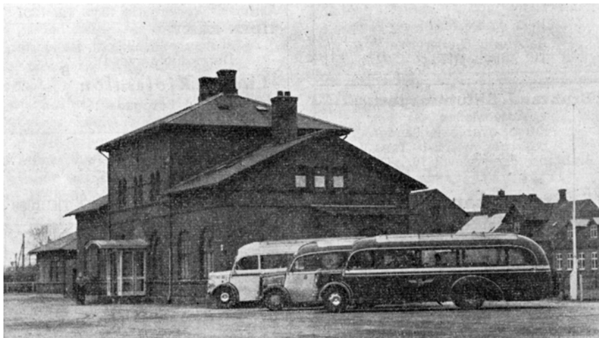
Tørring var et trafikalt knudepunkt med dels jernbaneforbindelse til Horsens og Thyregod, dels rutebilforbindelser til Vejle, Viborg, Silkeborg, Horsens, Brande, Brædstrup og Grindsted. På Tørring-Uldum kommunes initiativ blev den kollektive trafik, der berørte Tørring, i 1952 samlet ved jernbanestationen, da kommunen bekostede anlæg af holdepladser mv. Forreste bus er en Bedford OB årgang 1948 tilhørende Horsens Privatbaner, dernæst en Opel Blitz årgang 1940 fra ruten Tørring-Give-Grindsted, og bagest endnu en Bedford årgang 1948 formentlig fra Viborg-Vejle ruten.

Med udgangen af 1957 ophørte persontrafikken på HV, og den blev omlagt til buskørsel i banernes regi. I 1962 blev driften af HV helt indstillet, og der fremkom fra både etablerede rutebilejere og fra andre en lang række ansøgninger til Skanderborg Amt om tilladelse til at overtage HV's bilruter. HBS var imidlertid interesseret i at videreføre ruterne, og