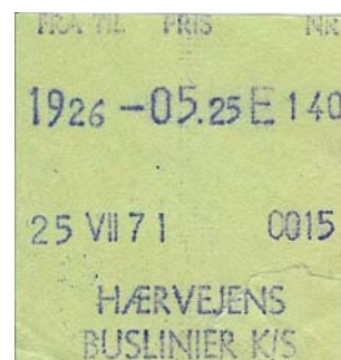
Billet fra 1971 udstedt på Al-mex A maskine.

Det er sandsynligt, at flere af centrene langs Hærvejen - som Viborg og Jelling - er opstået på grund af deres centrale beliggenhed ved vejen. Viborg var dengang kongehyldningssted og landsting, og i en periode i vikingetiden var Jelling kongeby. Efter vikingetiden opstod de fleste større byer langs kysten og ikke langs Hærvejen. Det var med til efterhånden at trække handelen væk fra Hærvejen, og efter jernbanens indførelse i midten af 1800-tallet forsvandt grundlaget for handelen.