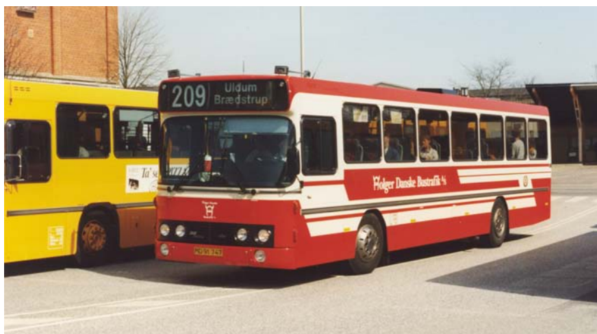
Salget til Holger Danske Bustrafik betød afsked med Hærvejens Bus Liniers karakteristiske navnetræk, og busserne fik i stedet påsat Holger Danske Bustrafiks bomærke, der består af en vikingehjelm efterfulgt af navnet. Vognfarve og vognumre forblev uændrede. Her ses DAB-Silkeborg serie 12 årgang 1990 (nr. 65) på Vejle rutebilstation.