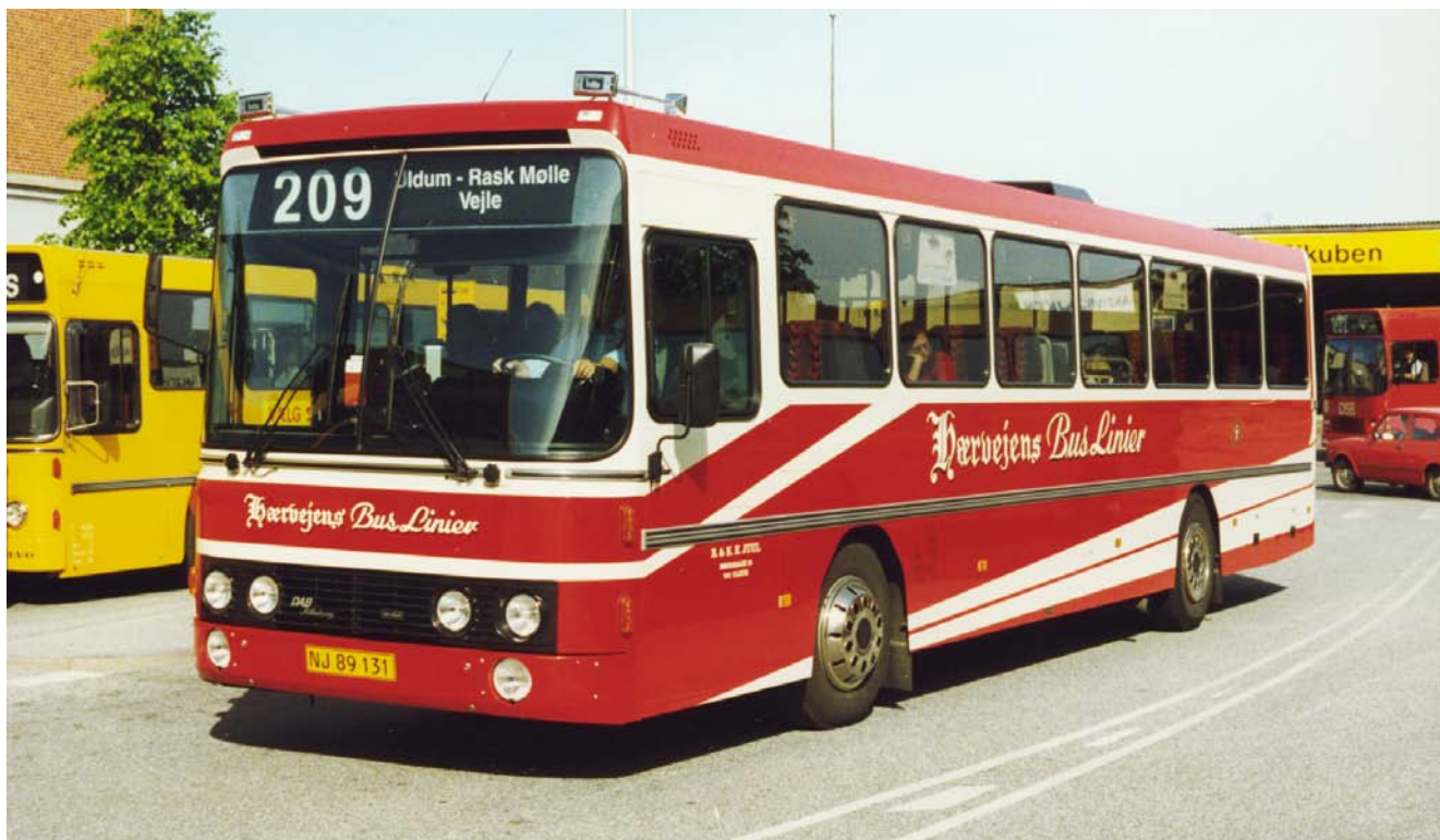
Hærvejens Bus Liniers 25 års jubilæum 1. april 1993 blev, ligesom 10 års jubilæet, fejret med levering af to nye busser. Den ene i komfortbus udgave, dvs. med høj - såkaldt - T-forrude og mere komfortable stole. Den var primært tænkt anvendt på de gennemgående E Bus ture på ruten Viborg-Vejle. Yderligere var de hvide stafferinger markant ændret i forhold til de seneste mere end 25 leverede vogne fra DAB. DAB-Silkeborg serie 12 årgang 1993 (nr. 68)

blev udskiftet med Holger Danske Bustrafiks ligeså karakteristiske navnetræk. Holger Danske Bustrafik var naturligvis ikke ubekendt med udbuddet, der "lurede om hjørnet", men der var alligevel skuffelse at spore hos ledelsen af selskabet, da resultatet af