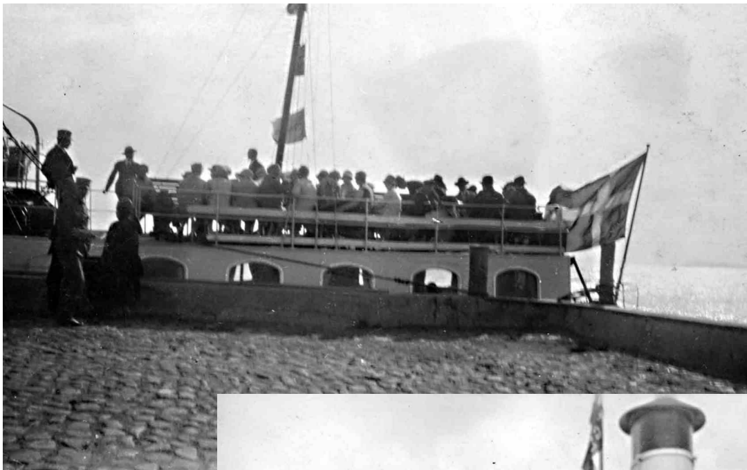
"På vej til Tyskland med Stege" - sådan står der i Erna Wad's fotoalbum. Datoen, anledningen og bestemmelsesstedet kender vi ikke, men M/S Stege er festligt pyntet med signalflag.