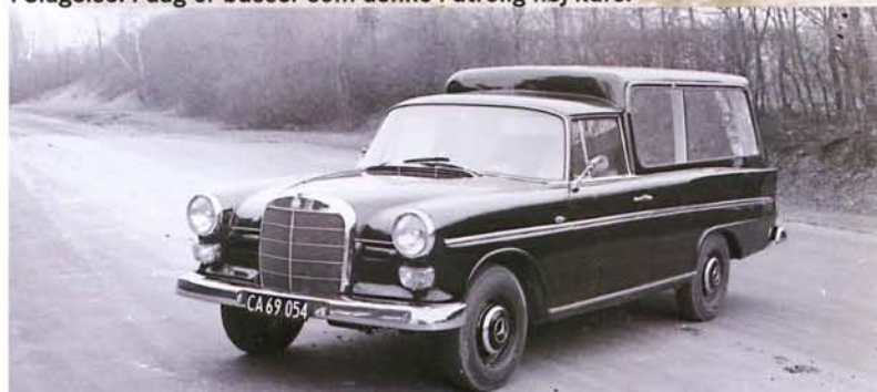
Rustvogn fra 1960'erne leveret til bedemand i Holbæk.