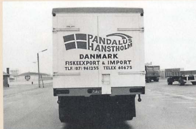
Pandalus - Kølevogn bagfra.