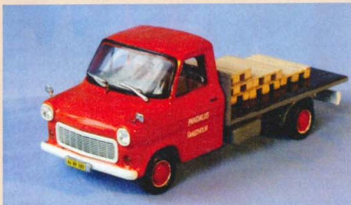
Forfatteren har ikke kunnet skaffe fotos af alle firmaets lastbiler. Derfor bringes i flere tilfælde billede af en af de modeller, der fremstillet i 1984. Her firmaets første bil, en Ford Transit 1250 fra 1968 i modeludgave.