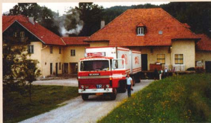
Pandalus - Scania 141 i Østrig.

Bogen på de 100 sider med over 150 illustrationer kan købes for 245 kr hos forlaget www.j-bog.dk