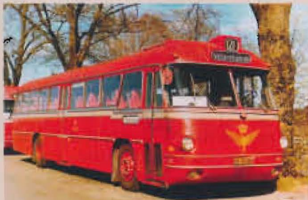
Ved indvielsen af S-banen til Vallensbæk i 1972 blev en del ruter lagt om. Volvo B655/Aabenraa fra 1963 supplerer den nye S-bane.

Historien fortælles gennem billeder – mere end 600 på bogen 208 sider, som viser os de første rutebiler og derefter mangelsituationen under besættelsen samt udvidelserne i årene derefter.