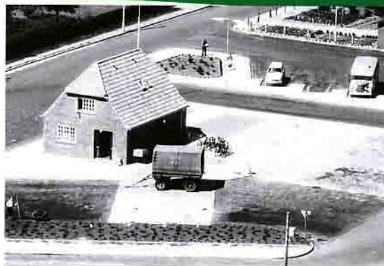
I 1955 blev persontrafikken indstillet på strækningen Skjern-Videbæk, og banen blev efterfølgende afkortet, så man undgik en overkørsel på hovedvejen (15) mellem Herring og Ringkøbing. Her ses en enlig DSB-påhængsvogn til stykgods ved rutebilstationen i Videbæk omkring 1956.