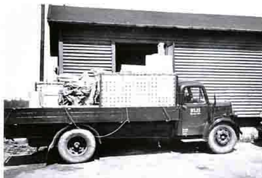
De danske privatbaner har tradition for at hjælpe hinanden. Her har Det Østsjællandske Jernbaneselskab (OSJS) udlånt sin Bedford O-lastbil til Næstved-Præsto-Mernbanen. Præsto 1960.