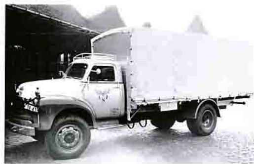
Lyngby-Nærum Jernbane (LNI) havde tidligt aftale med en privat vognmand om udkørsel af gods fra Lyngby. I 1946 overtog banen selv kørslen. Her er en Bedford A i banens karakteristiske solfarve ved leveringen i 1950'erne.