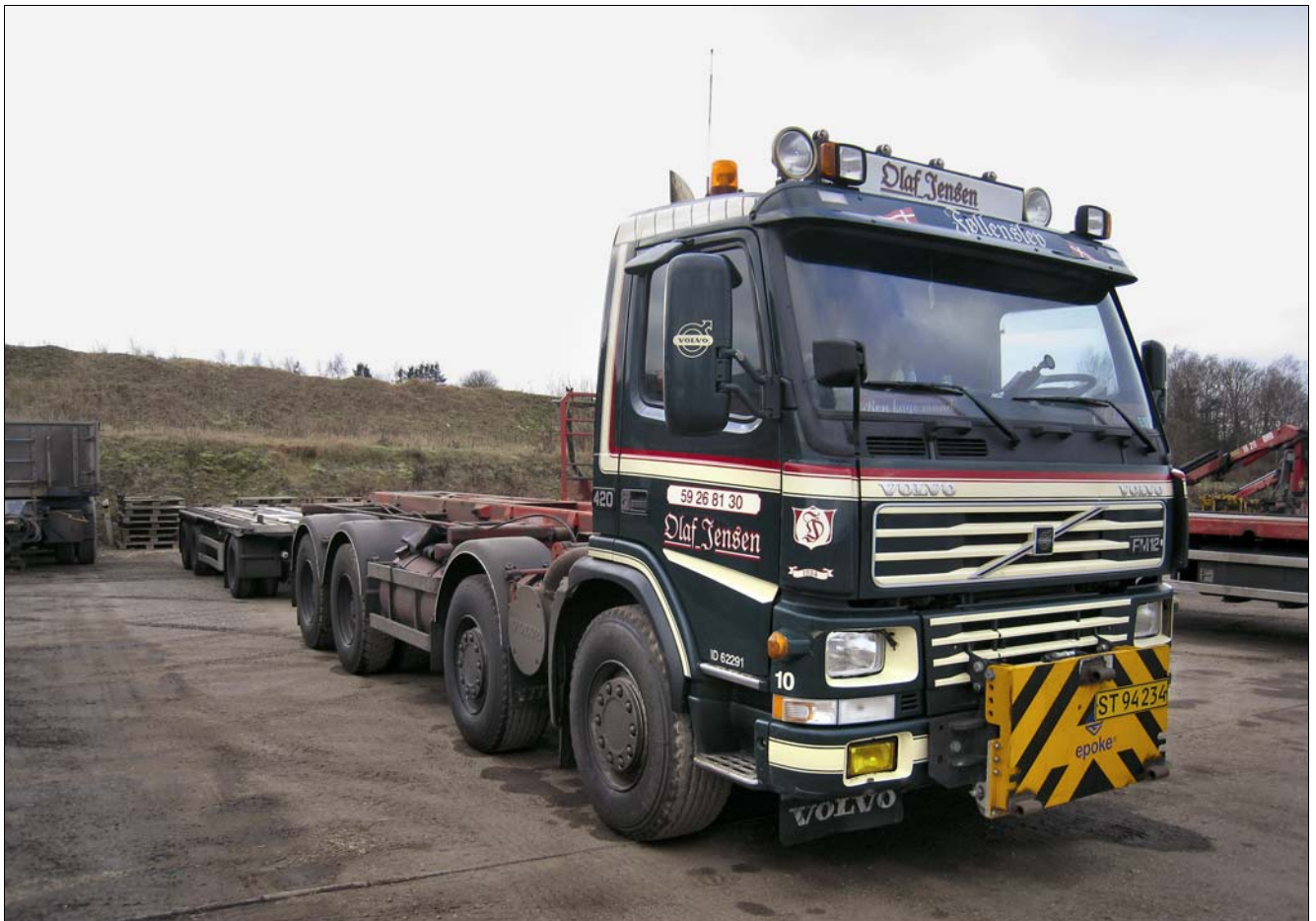
Volvo FM 12 årgang 2003 er forberedt til at rykke ud med sneplov.