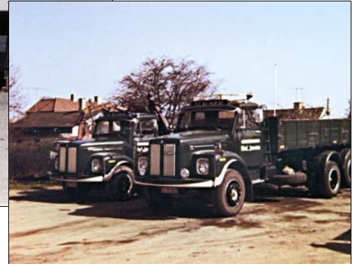
Scania-Vabis L56 med kran årgang 1967 og Scania LS 85 Super årgang 1972.