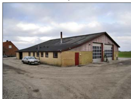
Værkstedet i Sandby.