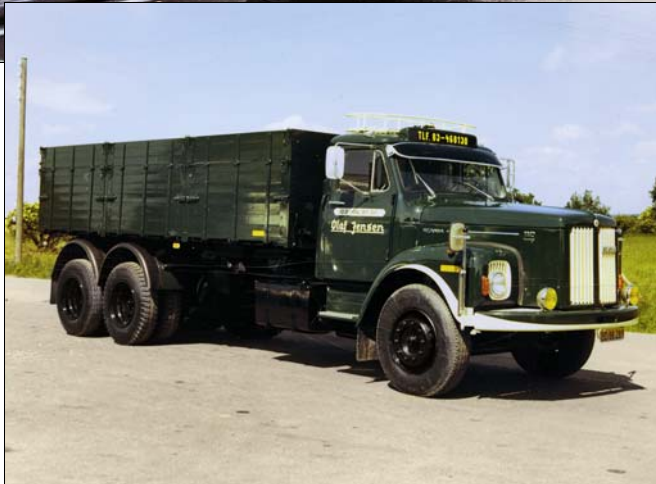
Scania LS 110 Super årgang 1971.