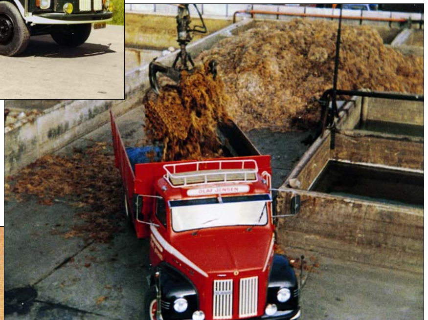
Scania L 50 Super årgang 1975 lægger tang i Havnsø for LITEX.