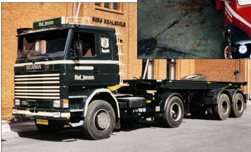
Scania R 112 årgang 1982 med sættevogn til transport af containere