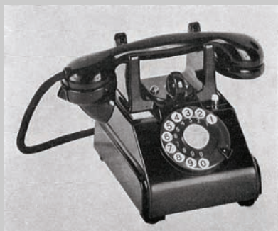
Herover en telefon af samme type som blev anvendt på Møn omkring 1960 – en såkaldt M36.

I mange år havde Møn sin egen telefonbog. Møn var Statstelefonområde, hvor det var Post- og Telegrafvæsenet der var ansvarlig for telefonen. Dengang havde man såkaldt partstelefon. Det vil sige, at der var to telefonabonnenter på samme ledning. Man kunne kun ringe én af gangen. Havde man et lige telefonnummer f.eks. 2248 var man partsabonnent med 2249, altså næste højere ulige nummer. På telefonerne var en lille rude, som viste hvilket nummer man havde. Det stod med sort. Nedenunder stod den anden partstelefon nummer med rødt. Skulle man ringe til sin partsabonnent skulle man ikke dreje dens nummer, men blot dreje 99! Dengang havde telefonerne nummerskive. Man kunne godt slippe for at være partsabonnent, men det kostede ekstra i abonnement. I midten af 1960'erne ophørte systemet med partsabonnement helt.