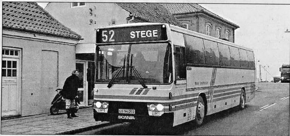
En af de sidste ture for Møns Omnibusser - inden bussen skiftede farve og begyndte at køre for et andet selskab.